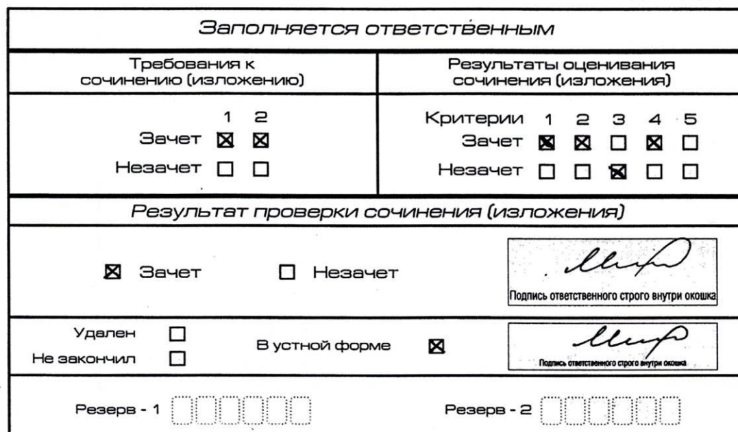
Рис. 10. Область для оценки работы сочинения (изложения) в устной форме

24. Заполнение полей бланка регистрации в случае если участник итогового сочинения (изложения) по состоянию здоровья или другим объективным причинам не может завершить написание итогового сочинения (изложения) (рис.12):