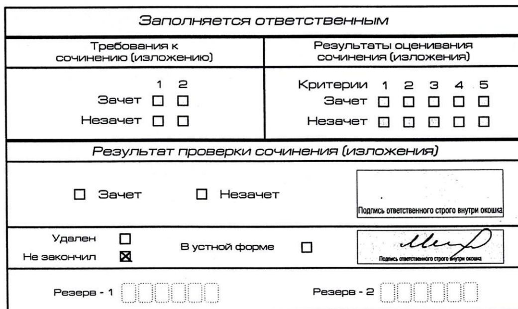
Рис. 11. Заполнение полей нижней части бланка регистрации (завершение написания сочинения (изложения) по уважительным причинам)

25. Заполнение полей бланка регистрации в случае если участник итогового сочинения (изложения) удален с итогового сочинения (изложения) (рис. 13):